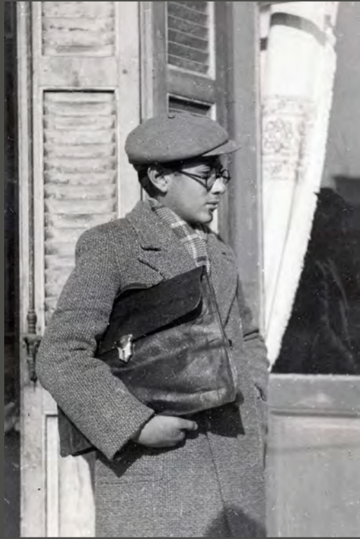
Στιγμιότυπα από την παιδική του ηλικία Αρχείο του ποιητή